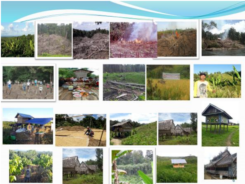
Gambar 1. Photo-photo ladang mulai dari tahap tebas-tebang sampai Panen dan penyimpanan padi serta lahan yang diberokan

di lumbung serta masa bero lahan bekas ladang, disajikan dalam photo-photo pada Gambar 1 di bawah ini.