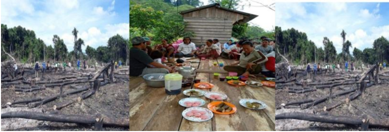
Gambar 4. Kegiatan Menugal dan Menikmati Hidangan Bersama di Ladang